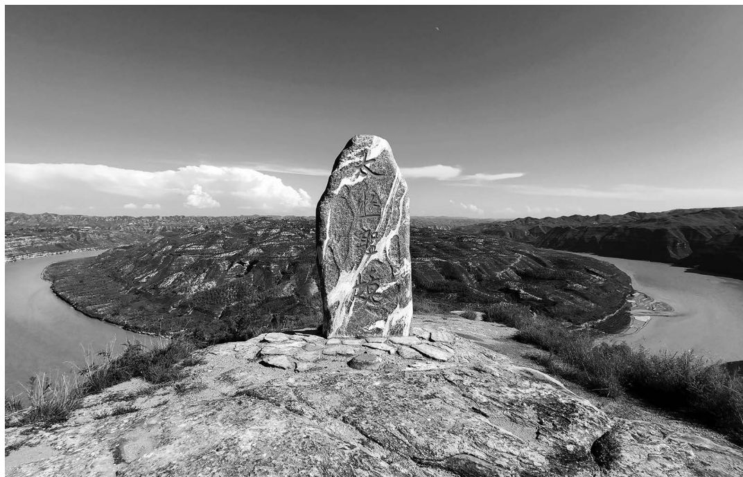
太极圣境

十，他眼里的世界，仍是他演绎的乾坤，四季祥瑞，朗朗而明。倘若我们把指向古老的长镜头最大限度地伸长，聚焦在亘古的时空深处，就会看见——伏羲仰观天象，俯法大地，观鸟兽之文，探宇宙玄机，近取之于身，远取之于物，始作八卦，孕育太极。他以超绝的智慧和过人的能量，通神明之德，类万物之情，斗转乾坤，领悟阴阳，拓成一幅太极阴阳图，就画在大河之上。